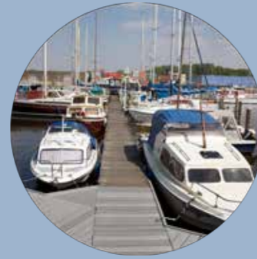
Bergen op Zoom